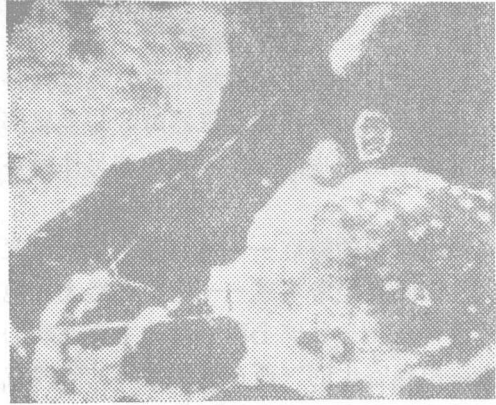
图3 在模拟气候的房间里试验5个周期之后TK10玻璃的表面形状。

上述证明，在热带条件下不仅外部的光学仪器另件，而且完全可能，内部的光学仪器另件要受到损坏。因此出口仪器要带到热带国家去，对于工业部门就提出了探索适当的保护光学另件方法任务。