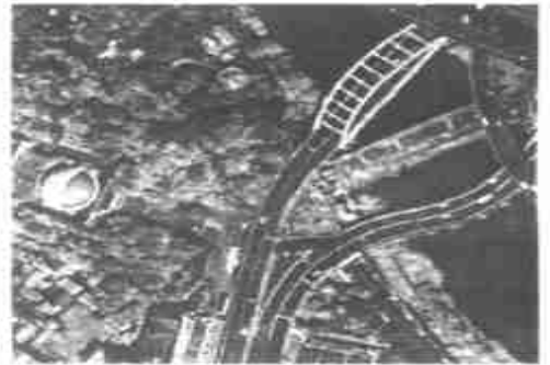
Fig. 4 Retrieval image