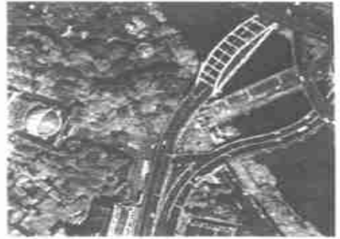
Fig. 3 Original image