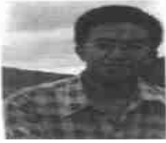
图 8 待隐藏信息