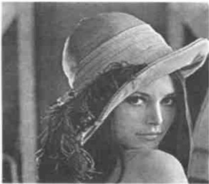
图 9 将图 8 隐藏入图 7 后的图像