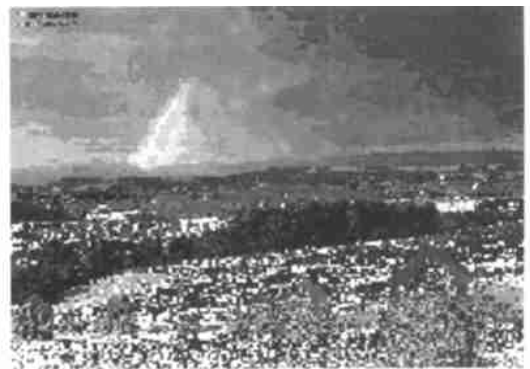
图 4 颜色量化到 128 色后的图像(未经误差扩散) Fig. 4 Image obtained after color quantization to 128 colors.