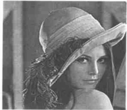
图 6. Lina 真彩色图像

首先,把一幅真彩色图像(图 6)进行颜色量化和误差扩散,便产生了载体图像(图 7),然后把待隐藏信息(图 8)隐藏在载体图像(图 7)中便产生了含有隐藏信息的合成图像(图 9),最后,接收方进行信息提取,便得到了包含在载体图像(图 9)中的隐藏信息(图 10)。