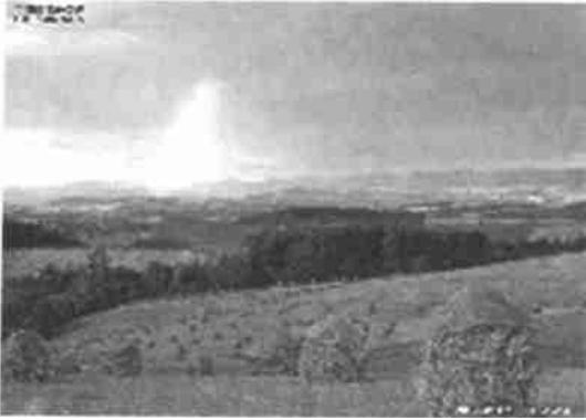
图 5 对图 4 进行经过误差扩散后的结果

Fig. 5 Result of Fig. 4 disposed by error diffusion.