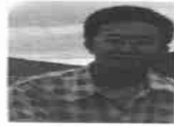
图 10 从图 9 中提取出来的隐藏信息