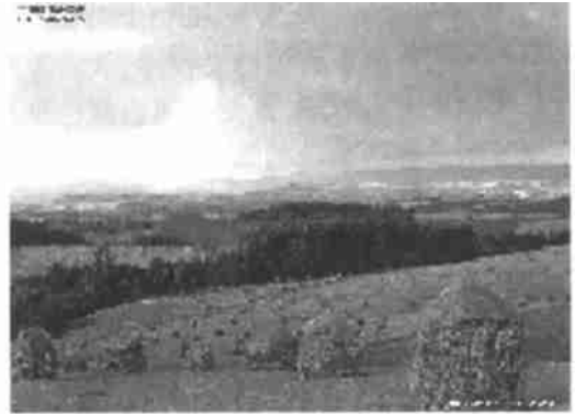
图 3 真彩色图像

图 3 是一幅真彩色图像,图 4 是把图 3 量化到 128 色后的结果(未经误差扩散处理),图 5 是把图 4 进行误差扩散处理后的结果。可以看出,误差扩散使得量化后的图像的质量有了明显的改善。