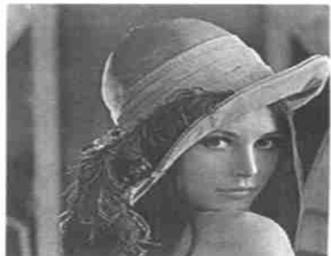
图 7 颜色量化到 128 色并进行误差修正的图像

Fig. 7 Result of Fig. 6 disposed by color quantization to 128 colors and error diffusion.