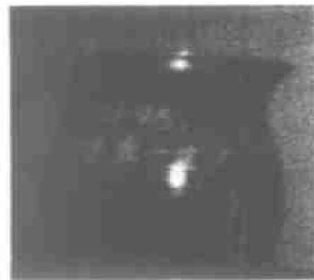
图 3 杯子

DMA 读取缓存区的数据,DMA 将自动按其控制寄存器的设置要求拼接传输数据。由于 DSP 内部也采用了双缓存机制,DSP 处理 DMA 传输的上一帧数据的同时,不影响 DMA 进行当前帧数据的传输,这样整个系统中 A/D 数据的采集、DMA 数据的传输及 CPU 数据的处理达到高度的并行性。图 3 所示的杯子是将数据拼接传输的方法应用到该系统后,成功采集到的图像。